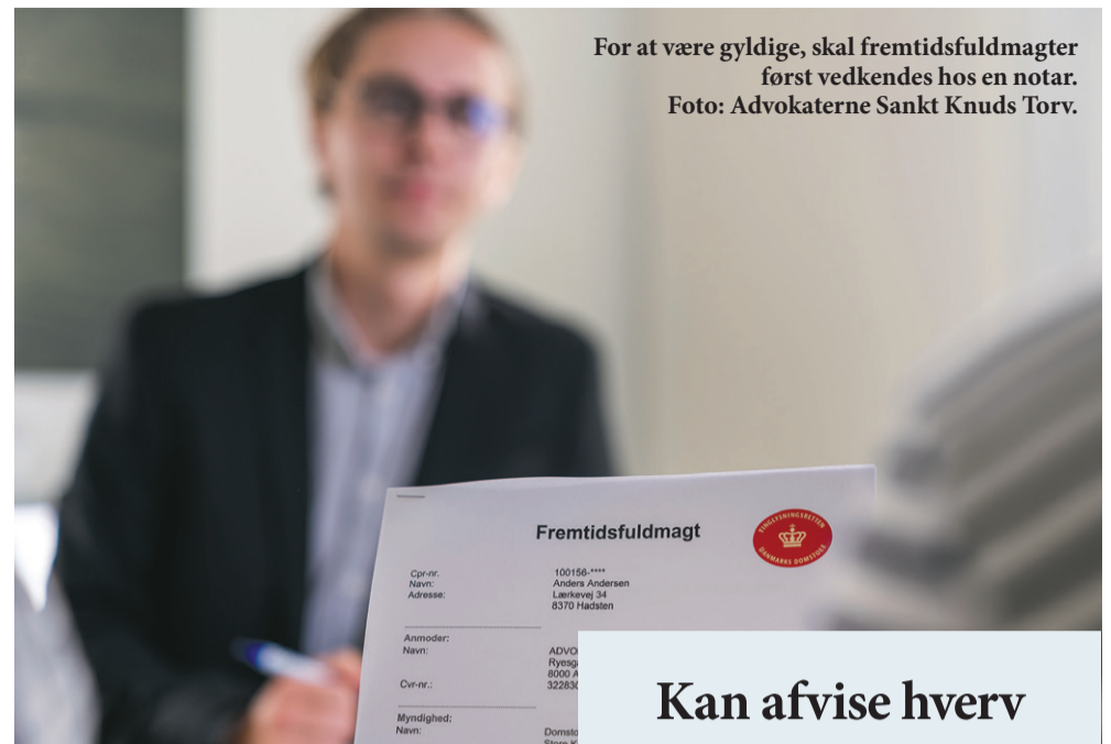
For at være gyldige, skal fremtidsfuldmægter først vedkendes hos en notar.

”For at få godkendt oprettelsen af fuldmagten skal man være i stand til at handle fornuftsmæssigt, som det hedder. Derfor duer det ikke at vente, til man for eksempel er hårdt ramt af demens. Samtidig ved man jo aldrig, hvornår